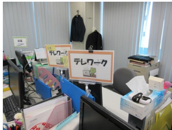
□ テレワーク（在宅勤務）勤務を表すボード