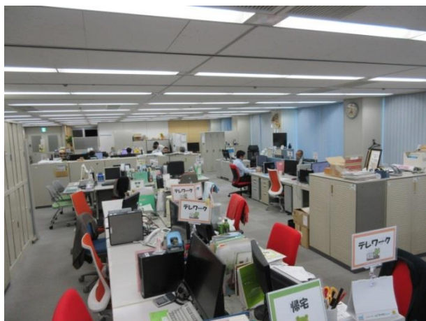
□ 空席が目立つ本社オフィスの模様