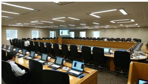
本社会議室の様子