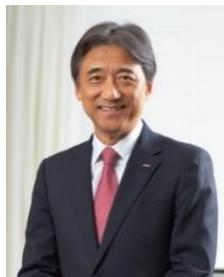
社長室から参加 ※会議途中からは移動の車内から参加