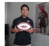
関西からラグビー 選手の挨拶も