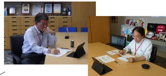
副社長室から参加