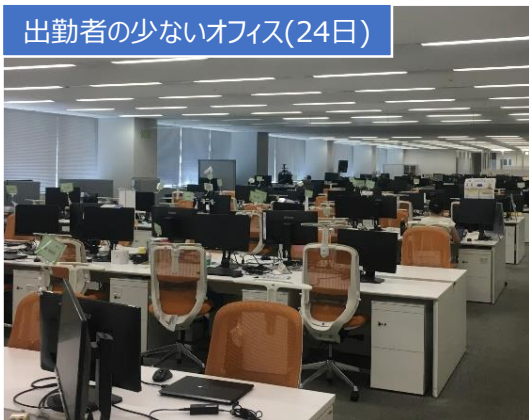
出勤者の少ないオフィス(24日)