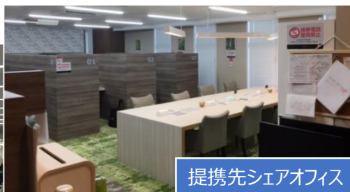
提携先シェアオフィス