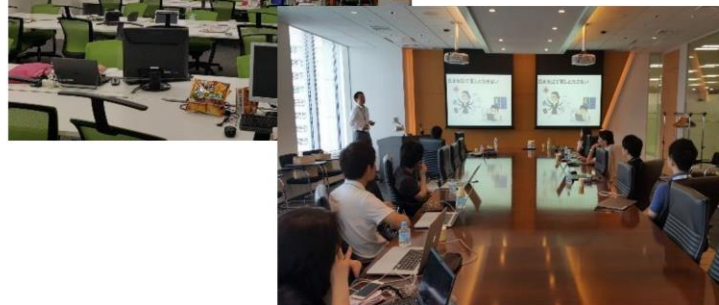
7/24 シスコ社員がカルビー様オフィスにて