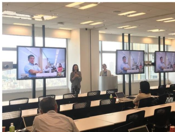
7/23 カルビー様社員がシスコオフィスにて