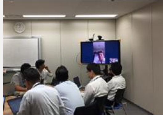
サテライトオフィスからTV会議で会議に参加