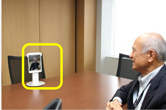
リモートから角度を変えられるデバイスを使った TV会議参加