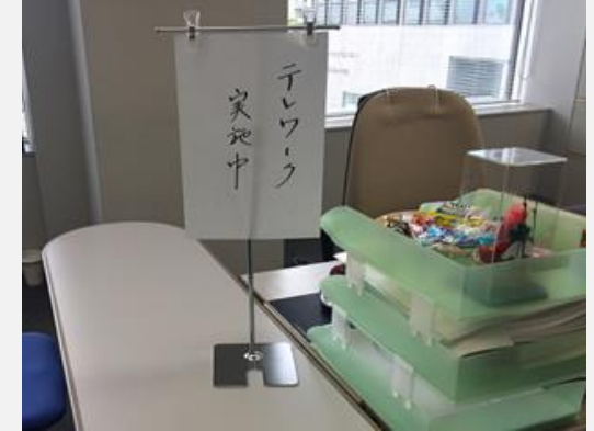
テレワーク中で不在を周囲に知らせる立札