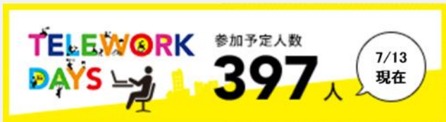
テレワーク・デイズ参加募集バナー