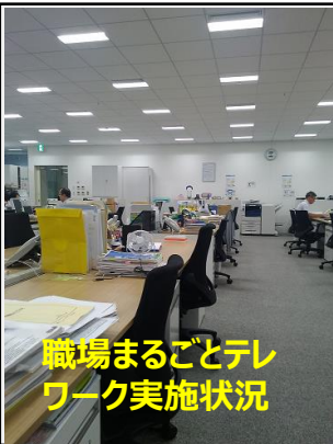
職場まるごとテレワーク実施状況