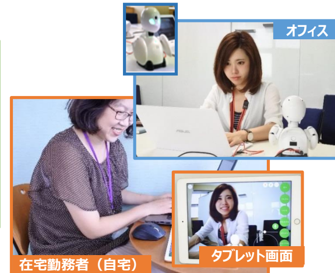
分身ロボットを活用したテレワーク風景