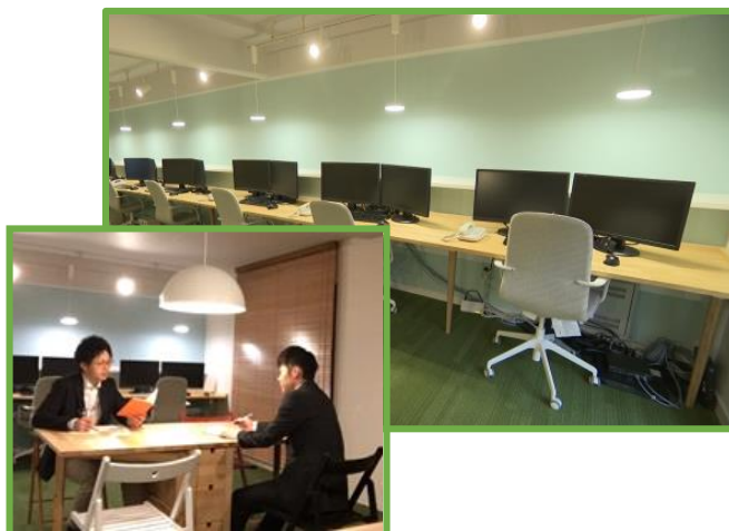
社宅を改装したサテライトオフィスの利用風景