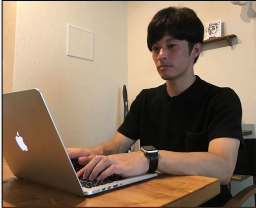
自宅での在宅勤務利用風景