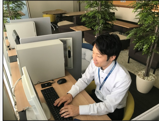
サテライトオフィスの利用風景