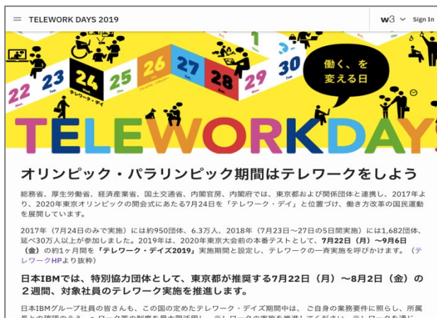
イントラサイトでの告知