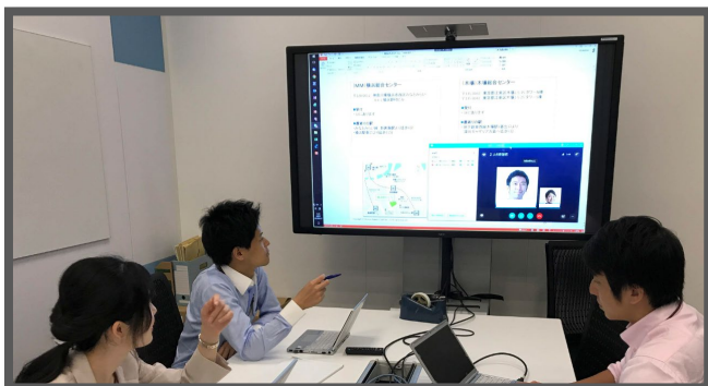
写真1：複数拠点を繋いだリモート会議の様子