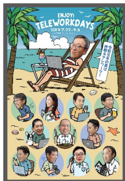
写真2：部門対抗ポスター選手権の作品