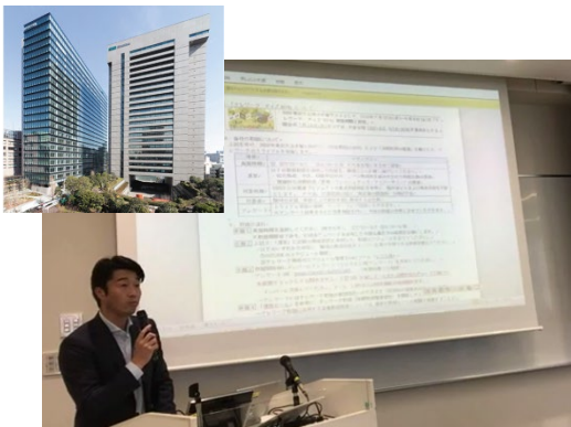
◀ テレワーク・デイズ社内説明会の様子

本社ビルおよび東京本部の各職場向けの説明会を実施し、職場の代表者約200名が説明会に参加しました。