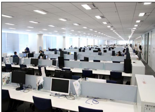
空席が目立つ豊洲本社