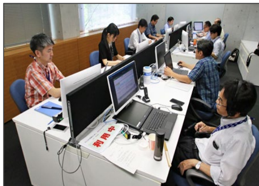
多摩サテライトオフィスの様子