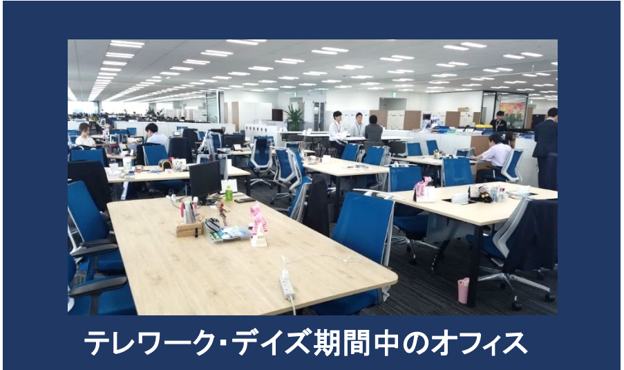
テレワーク・デイズ期間中のオフィス

在宅勤務を行う女性社員。 昨年のテレワーク・デイズでは営業職の社員を中心とした参加だったが、今年は適応範囲を社内全体へ拡大。「通勤によりストレスを感じたり体調を崩すこともなく働きやすかった」とポジティブな意見が多く集まる一方、継続するとなるとペーパーレス化等の課題が確認された。