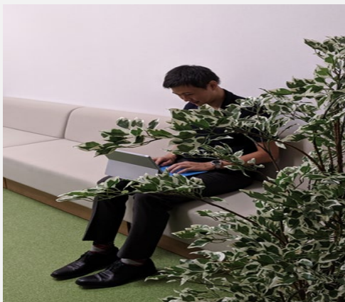
モバイルワークの風景