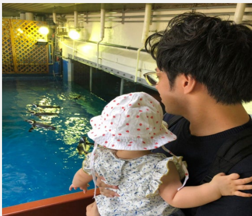
テレワークによって生まれた余暇を楽しむ風景